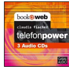
Claudia Fischer telefonpower Gabal Verlag 2007, 3 CDs (ca. 140 min), 45,90 EURO

Denn welcher kleinere oder mittelständische Betrieb kann sich einen hauptberuflichen Pressereferenten leisten oder verfügt gar über einen üppigen PR-Etat? Vielmehr müssen oft Mitarbeiter aus dem Marketing, der Personalabteilung oder die Geschäftsführer selbst die Pressearbeit nebenbei mit erledigen. Für sie ist der Umgang mit den Medien oft ein neues Terrain. So sind die vorliegenden 99 Tipps für diejenigen konzipiert, die als „Quereinsteiger“ einen schnellen, fundierten und an der Praxis orientierten Zugang zum Thema suchen.