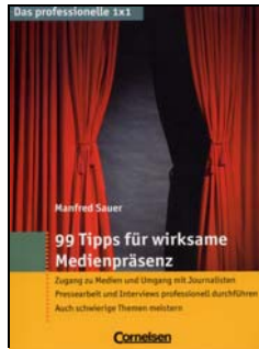
Manfred Sauer 99 Tipps für wirksame Medienpräsenz Zugang zu Medien und Umgang mit Journalisten, Pressearbeit und Interviews professionell durchführen. Auch schwierige Themen meistern. Cornelsen Verlag 2006, 190 Seiten, 14,95 EURO

Ekkehard Nüssl von Rein hat die deutsche Weiterbildungslandschaft entscheidend geprägt. Genauso wie er es immer vermieden hat, sich durch monokausale Sichtweisen einschränken zu lassen, bearbeiten die Autoren der Festschrift ein breites Spektrum an Themen und Sichtweisen und präsentieren die Weiterbildung als Zunft mit Zukunft.